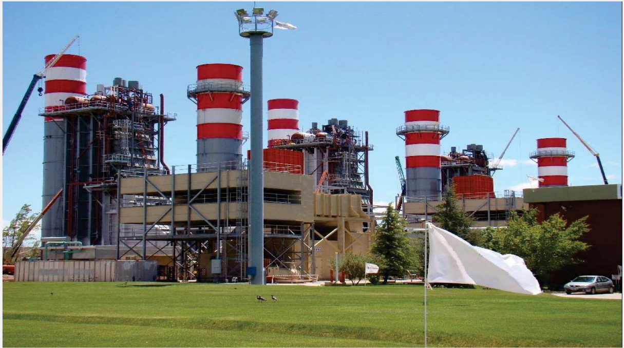
Plantas de Ciclo Combinado

Refinerías, Plantas Industriales, Ciclos Combinados, Termosolares, Biodiesel y Bioetanol, Desalación y Depuración, Laboratorios Farmacéuticos, Plantas de Alimentación, Navales, Nucleares