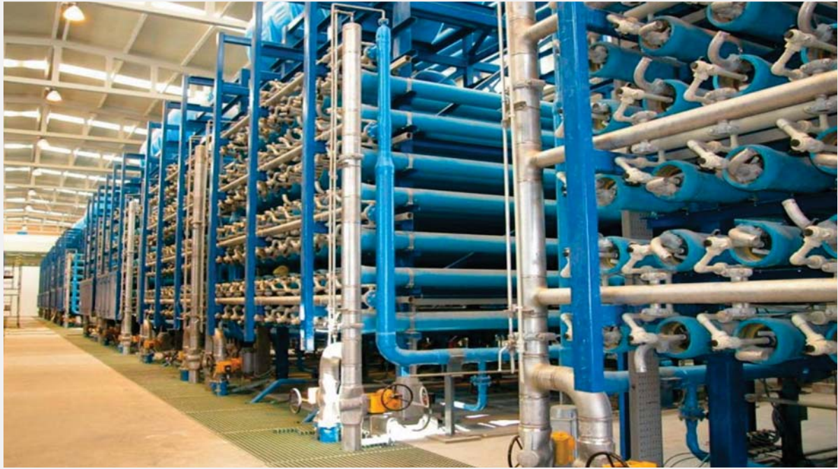
Desalación y Depuración

Refinerías, Plantas Industriales, Ciclos Combinados, Termosolares, Biodiesel y Bioetanol, Desalación y Depuración, Laboratorios Farmacéuticos, Plantas de Alimentación, Navales, Nucleares