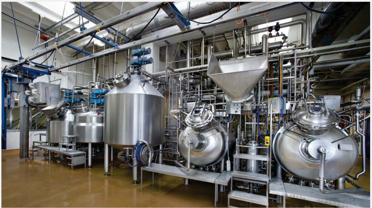
Plantas de Alimentación