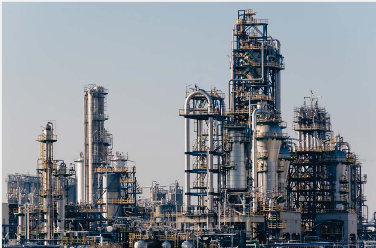
Plantas Petroquímicas y Refinerías